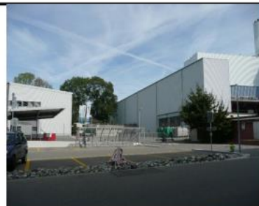
Treffpunkt beim Parkplatz vor dem Info-Zentrum