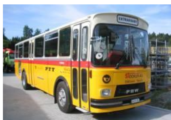
Stocker Oldtimer Postauto